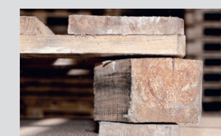
Blocchetto ritorto > protrusione di circa 1 cm