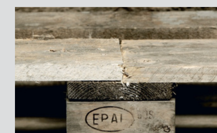
Riparazione non conforme alle specifiche