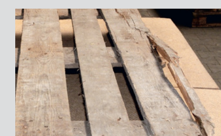
Traverse rotte, tavola rotta completamente o in parte