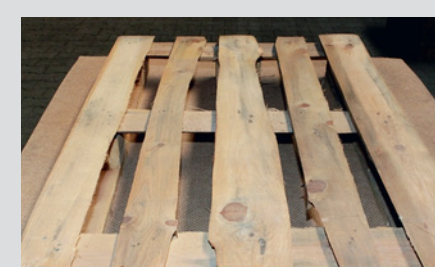
Componenti inaccettabili con assenza di conformità ai Regolamenti Tecnici EPAL, es.: sottodimensionati, marci, bordo squadrato male