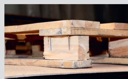
Punta del chiodo visibile o presenza di più di 2 chiodi (gambi) per pallet