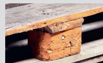
Sporco o contaminazione che potrebbe essere trasferito al carico, es.: vernice, olio, odore, muffa, macchie di umidità, ecc.